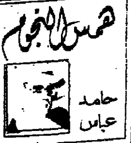
كرويات .. ١٤

●● سيحان مغير الاحوال، فريق نادي الهلال الذي لعب مع الكوكب المراكشي، وأدى مباراة رائعة المستوى ونتيجة كبيرة اهتز مع فريق شباب القبائل، تيزي أوزو، بعد يومين ولم يستطع ان يفعل شيئاً سوى الهدف الذي سجل في اول المباراة ثم اصبح تأمله مرهوناً بالقرعة، عجباً لهؤلاء اللاعبين ولهذه الكرة!!